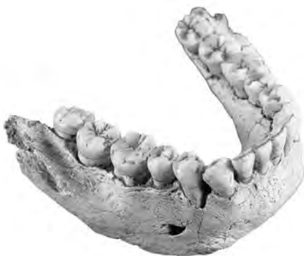
Abb. 1: Frühmenschlicher Unterkiefer aus Dmanisi