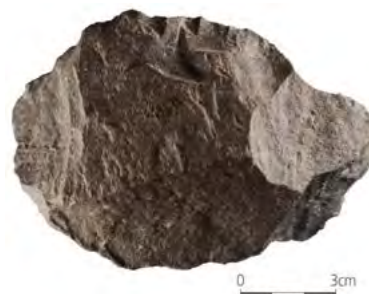
Abb. 2: Steinartefakt aus Dmanisi